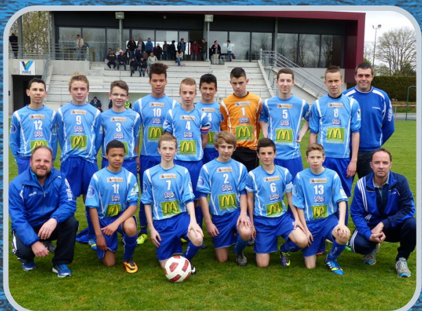
U15A - 2014/2015