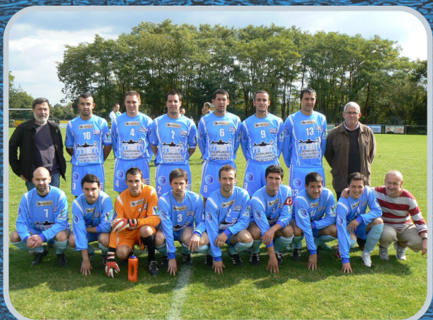
SENIORS A - 2011/2012

ENVOYEZ-NOUS VOS PHOTOS SOUVENIRS À communicationesv@gmail.com