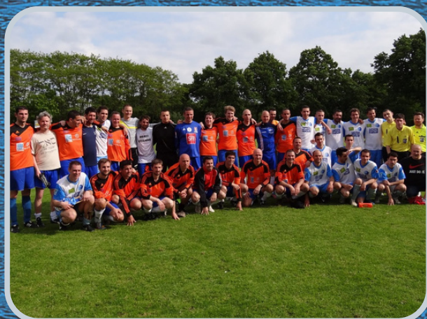
50 ans ESV - 2013