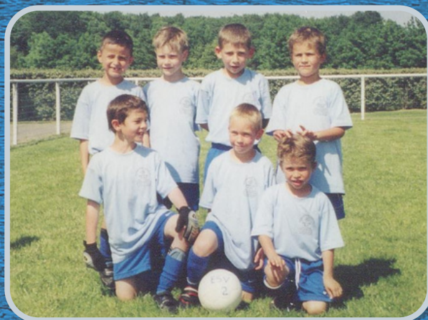
U8/U9 - 2003/2004